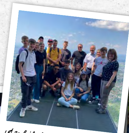
Azubifahrt / Wandern