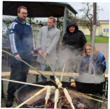
Stockbrot am Lagerfeuer